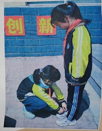
承德市承德县第二实验小学开展“学雷锋好少年”主题教育实践活动。

近日，滦平县教育和体育局组织全县33所中小学共3万余名学生集中开展学雷锋志愿服务主题系列活动。各校通过举行升旗仪式、开展主题班会、观看雷锋事迹视频、读雷锋日记等活动，进一步引导学生了解雷锋先进事迹，感悟雷锋精神时代内涵，学习雷锋精神。 通过本次系列活动，让中小学生在坚定理想信念、从点滴做起，不断提高自身道德修养，树立正确的三观，争做雷锋式好少年，在实践中加深对雷锋精神的认识，使雷锋精神发扬光大，传承不息。