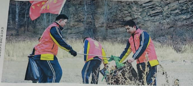
承德市承德县第二实验小学开展“学雷锋好少年”主题教育实践活动。