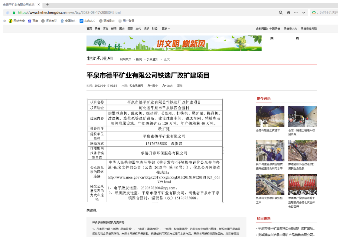
图 1 一次公示网上链接截图