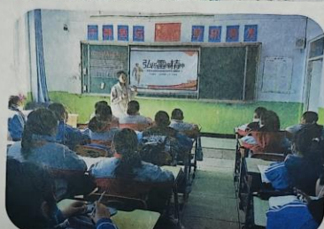
滦平县鹿坪岭镇中心校开展“学雷锋、学雷锋、学雷锋”系列活动。

近日，滦平县教育和体育局组织全县33所中小学共3万余名学生集中开展学雷锋志愿服务主题系列活动。各校通过举行升旗仪式、开展主题班会、观看雷锋事迹视频、读雷锋日记等活动，进一步引导学生了解雷锋先进事迹，感悟雷锋精神时代内涵，学习雷锋精神。 通过本次系列活动，让中小学生在坚定理想信念、从点滴做起，不断提高自身道德修养，树立正确的三观，争做雷锋式好少年，在实践中加深对雷锋精神的认识，使雷锋精神发扬光大，传承不息。