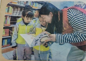
承德市承德县第二实验小学开展“学雷锋好少年”主题教育实践活动。