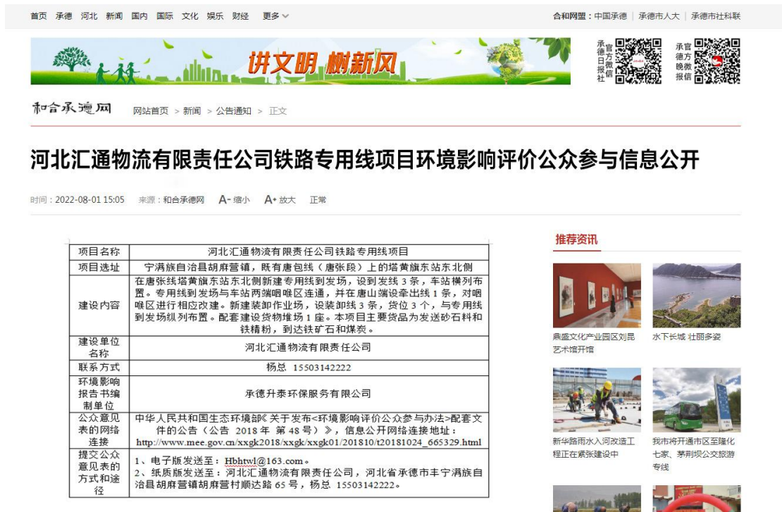
一次公示网上链接截图