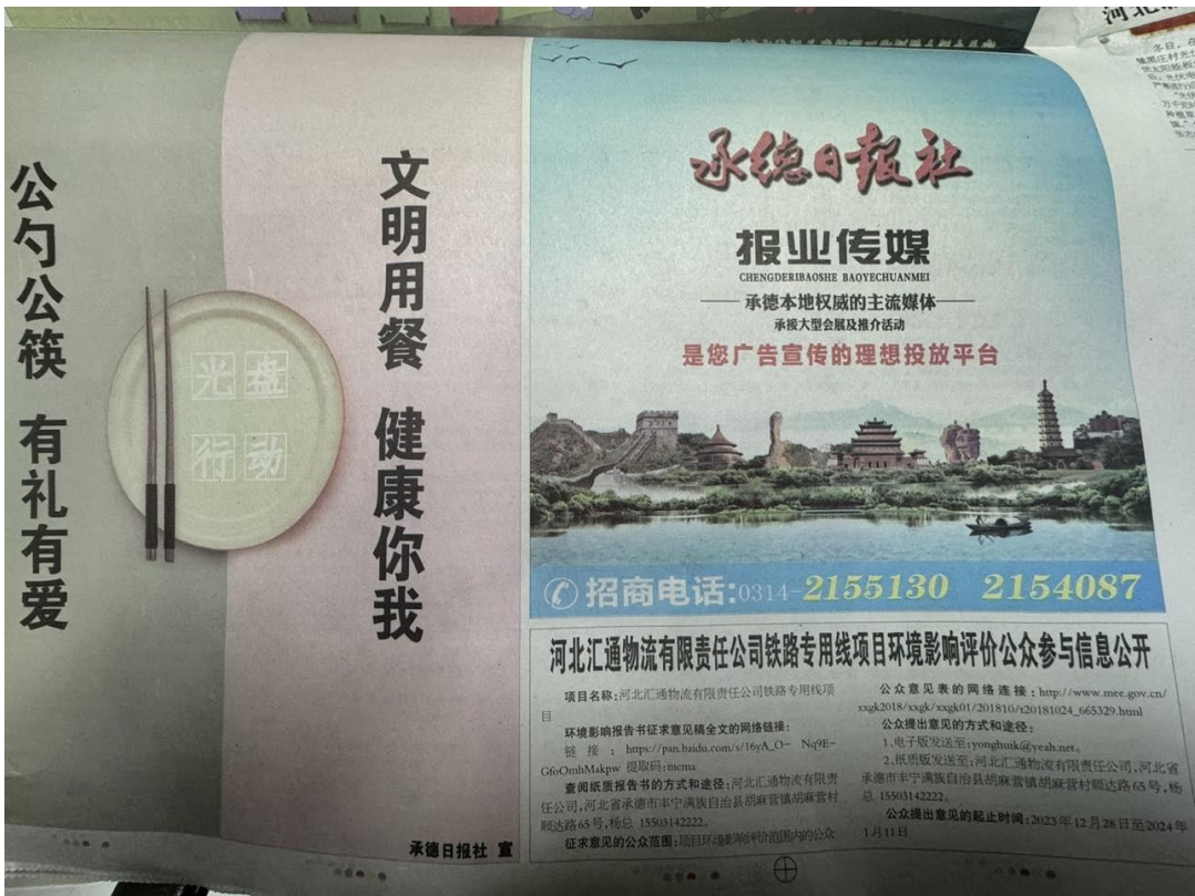
第二次报纸公开照片如下：