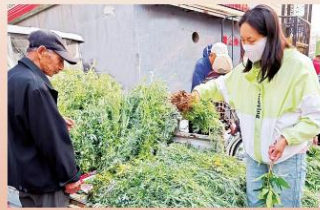
门前挂上艾草可以驱赶蚊虫;艾叶散发特殊气味,可以提神醒脑。买艾草买的是传统,买艾草买的是情怀。