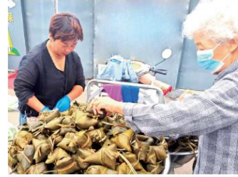
街头市民争相购买香甜可口的粽子。

“五月五,是端阳;插艾叶,挂香囊;五彩线,手腕绑;吃粽子,蘸白糖;龙舟下水喜洋洋……”朗朗上口的童谣传颂着端午节的文化习俗。端午节作为我国首个入选世界非遗名录的节日,以其悠久的历史和丰富的文化内涵,传承着中华民族的精神命脉。