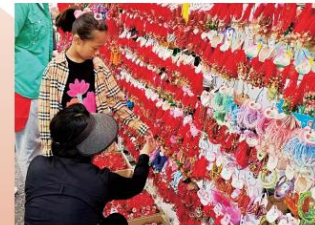
系上五彩线是端午节的重要习俗,大人孩子都可以系,表达了祈福纳吉的美好寓意。