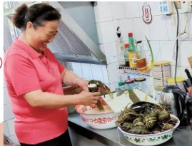
包粽子是一项“大工程”,不仅包进了香甜的糯米更是包进了吉祥与健康。

“五月五,是端阳;插艾叶,挂香囊;五彩线,手腕绑;吃粽子,蘸白糖;龙舟下水喜洋洋……”朗朗上口的童谣传颂着端午节的文化习俗。端午节作为我国首个入选世界非遗名录的节日,以其悠久的历史和丰富的文化内涵,传承着中华民族的精神命脉。