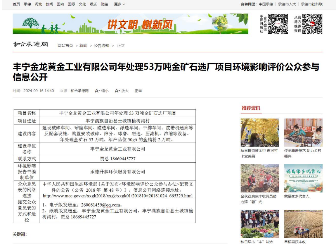
一次公示网上链接部分截图