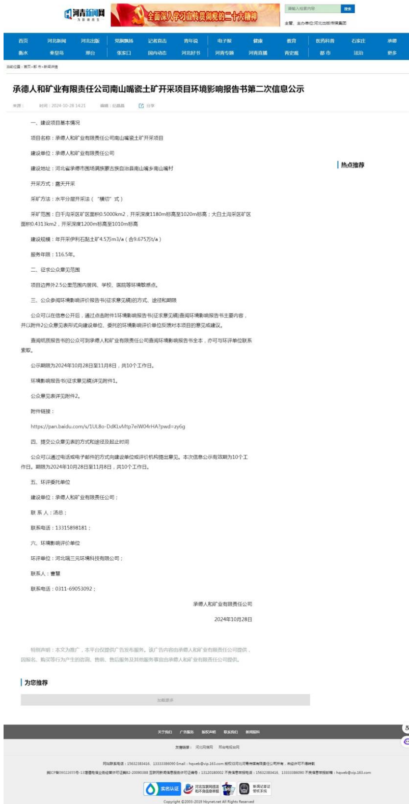
图 2 第二次网上信息公示截图