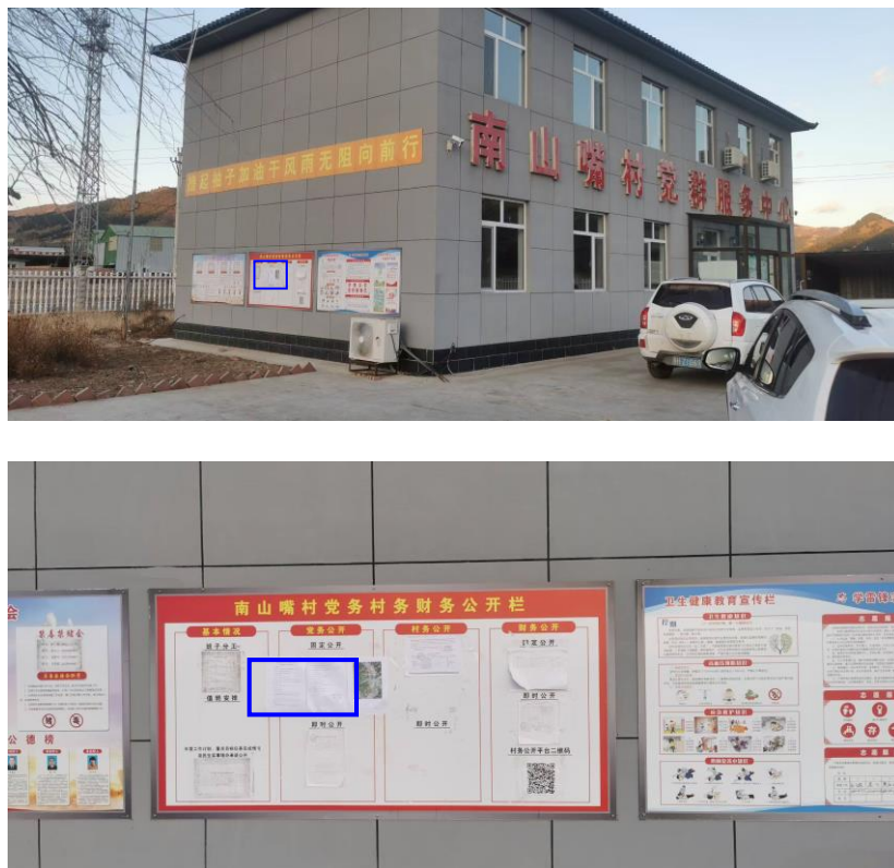
图 5 第二次张贴公示照片

承德人和矿业有限责任公司于 2024 年 10 月 29 日在评价范围内北山咀（自然村，隶属于南山嘴村）、黑林子（自然村，隶属于南山嘴村）、后七棵树（自然村，隶属于南山嘴村）、五百沟门（自然村，隶属于南山嘴村）、前白杆沟门（自然村，隶属于南山嘴村）、南山嘴村、前七棵树（自然村，隶属于南山嘴村）、刘家窝铺（自然村，隶属于南山嘴村）、岳家窝铺（自然村，隶属于南山嘴村）、双岔沟门（自然村，隶属于南山嘴村）、头道沟门（自然村，隶属于南山嘴村）、沙窝子（自然村，隶属于南山嘴村）、半砬沟门（自然村，隶属于南山嘴村）等 13 个敏感点进行张贴公告。张贴公告照片见图。