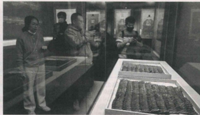
1月25日,游客在中国国家博物馆内参观。

濮滨河旧石器时代遗址等六项入选 备受关注的“2023年中国考古新发现”1月30日在北京发布,四川泸州市濮滨河旧石器时代遗址、福建平潭县壳丘头新石器时代遗址、湖北荆门市屈家岭新石器时代遗址、陕西渭源县周原商代遗址、新疆吐鲁番市西凉亭时期佛教寺院遗址、内蒙古巴林左旗上京遗址等六项入选。另有七个遗址项目入围“2023年中国考古新发现”,它们分别是:河南许昌朱庄龙山文化遗址、内蒙古清水河县后城子新石器时代遗址、河南郑州市书院街商代贵族墓地、青海都兰县夏尔迪玛可布青铜时代遗址、甘肃礼县四角坪秦代礼制建筑遗址、新疆喀什市汉唐时期墓葬遗址、山西霍州市陈金寺晋代窑址。