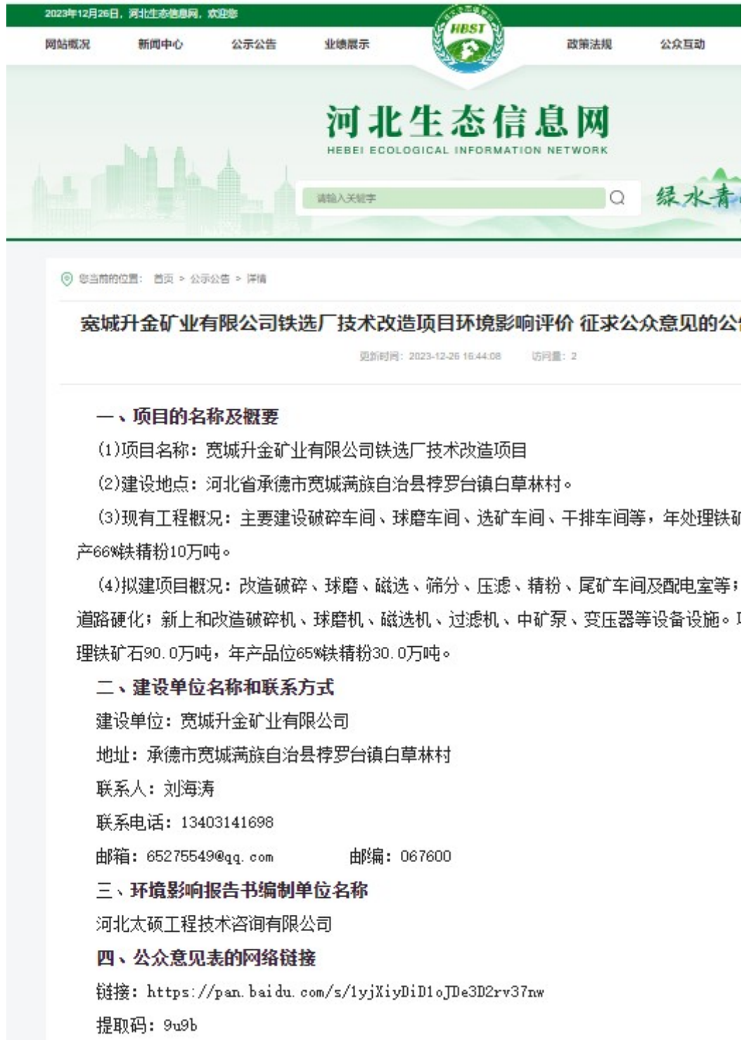
图2 第一次网络公示图片

第一次公示在河北生态信息网进行公示，河北生态信息网（ https://www.hbstxxw.com/ ）关注的公众较多，易于项目信息的传播。第一次网络公示截图见图1。