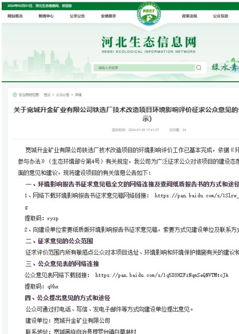
图3 第二次网络公示图片